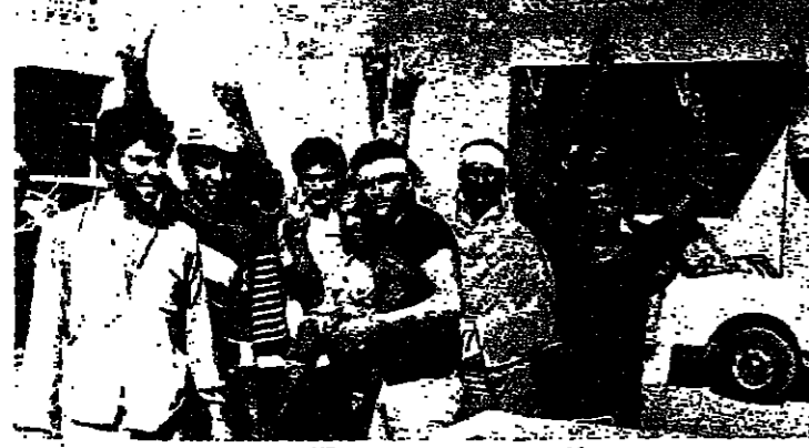
الخوارج اخرج عنهم من معتقلات صور